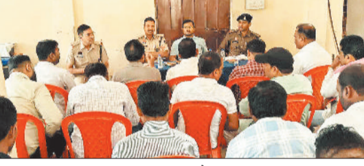
हरिभूमि न्यूज ► विश्रामपुर

होली और रमजान पर्व को शांतिपूर्वक संपन्न कराने के उद्देश्य से उच्चाधिकारियों के निर्देश पर रविवार को विश्रामपुर और रमजान का पर्व आपसी सौहार्द एवं शांति के साथ मनाने की अपील की। उन्होंने अधिकारियों से होली के दिन सामुदायिक स्वास्थ्य केंद्र में इमरजेंसी सेवाएं सुचारु रखने, चिकित्सकों की विशेष इ्यूटी लगाने तथा एंबुलेंस की समुचित व्यवस्था सुनिश्चित करने का निवेदन किया। साथ ही नदी-नालों, स्टॉप डेम व एनिकेट में किसी भी दुर्घटना की स्थिति में गोपालखोरा की टीम और ऑन कॉल उपलब्ध कराने का भी आग्रह किया गया। बैठक में नशे की हालत में वाहन न चलाने, तीन सवारी न बैठाने तथा किसी को जबरन रंग न लगाने पर सहमति बनी। सभी चेकिंग प्वाइंट पर