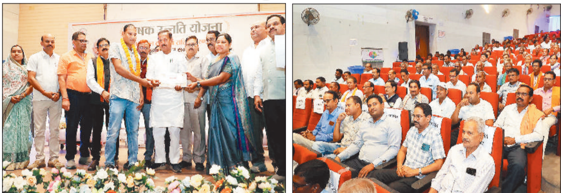
किसान को प्रमाण पत्र सौंपते राज्यसभा सांसद और कार्यक्रम में उपस्थित किसान।

इस दौरान जिले के किसानों को पुष्पहार से स्वागत किया गया और उन्हें प्रमाण पत्र दिया गया। इस साल जिले में 72 हजार 693 किसानों ने समर्थन मूल्य पर धान बिक्री किया है। इन किसानों ने 4 लाख 78 हजार 240.60 एमटी धान बिक्री किया है। इसकी राशि तो पहले ही मिल गई थी, लेकिन बोनस की राशि बाकी थी। शनिवार को इस राशि को किसानों के खाते में जमा करने बिलासपुर में एक कार्यक्रम का आयोजन किया गया था। यहां सीएम श्री साय ने एक क्वीक कर किसानों के खाते में राशि अंतरण किया। इस अवसर पर वृत्तुअल माध्यम से किसानों को संबोधित करते हुए मुख्यमंत्री विष्णुदेव साय ने कहा कि आज का दिन किसानों के सम्मान और स्वाभिमान का दिन है। उन्होंने कहा कि