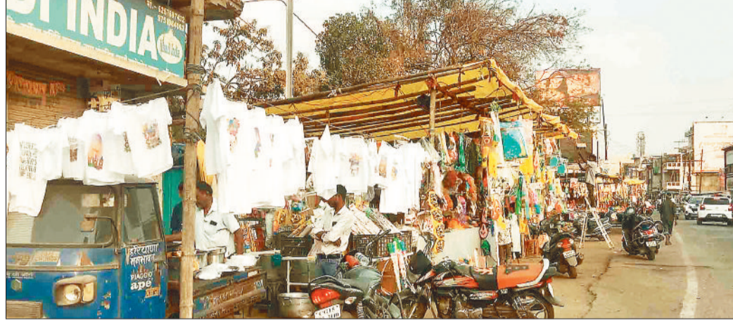
होली के लिए रंग, गुलाल व मुखौटों से सजी दुकान।

होली त्यौहार को एक दिन शेष है वहीं होलिका दहन को लेकर तैयारियां जोरों पर हैं। सोमवार को शुभ मुहूर्त पर होलिका दहन किया जाएगा। इधर अब शहर में होली का बाजार सज गया है। बाजार में मुखौटे, नकली बाल, मूछ के साथ कई रंग के आबीर-गुलाल और रंग-बिरंगी पिचकारियां आ गई हैं। इस बार बाजार में बच्चों को लुभाने कई तरह की पिचकारी भी आई है। गन पिचकारी की भी बाजार में धूम मची हुई है। अभी खरीदारी करने ग्राहक कम आ रहे हैं वहीं दुकानदार होली के एक दिन पहले बेहतर बिकवाली की उम्मीद लगाए बैठे हैं। शहर में होलिका दहन से लेकर परंपरागत तैयारी चल रही है। हालांकि इस बार पिचकारी और रंगों के दाम में 10 से 20 फीसद तक दाम बढ़ गए हैं। शहर के घड़ी चौक, देवीगंज रोड, स्कूल रोड, सदर रोड सहित लगी-मोहल्लों में छोटी-बड़ी दुकानें चल चुकी हैं। थोक कारोबारियों ने भी भरपूर स्टॉक मंगाया है। इस बार अच्छी ग्राहकी की उम्मीद में व्यापारियों ने सामान लाया है। हर्बल गुलाल सहित पिचकारियों के दाम भी 10 से 20 फीसद तक बढ़ गए हैं। व्यापारियों का कहना है कि इस बार बाजार में भी रौनक है। पिछले साल को